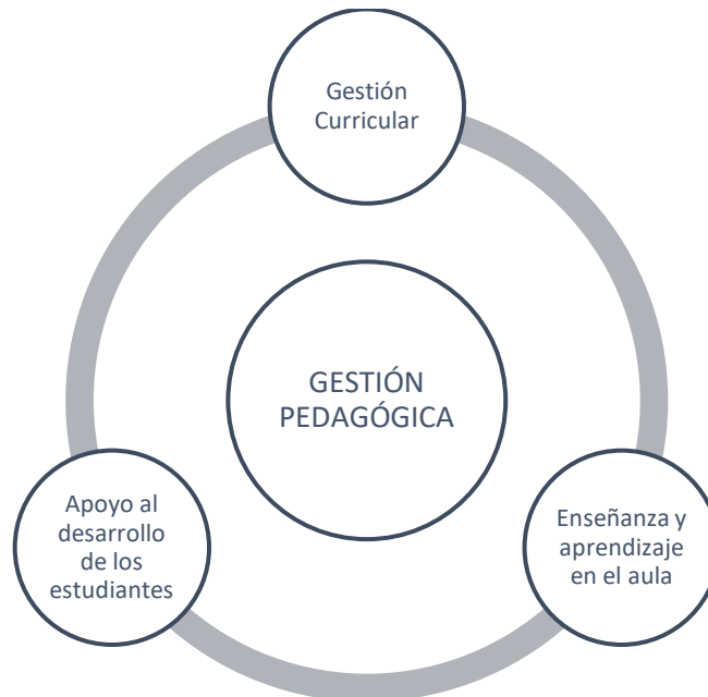
Cuadro N° 1 50