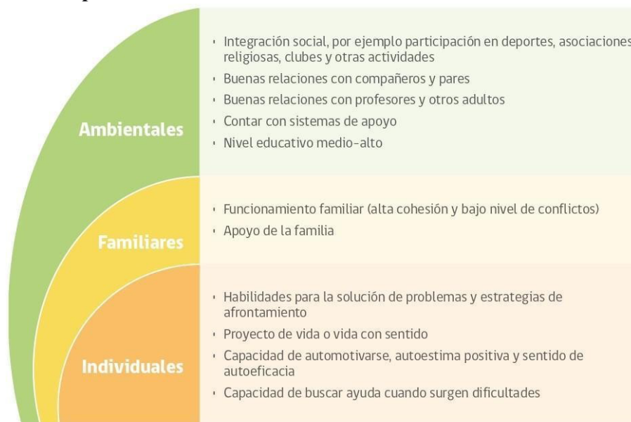
Figura 3: Factores protectores en la conducta suicida.