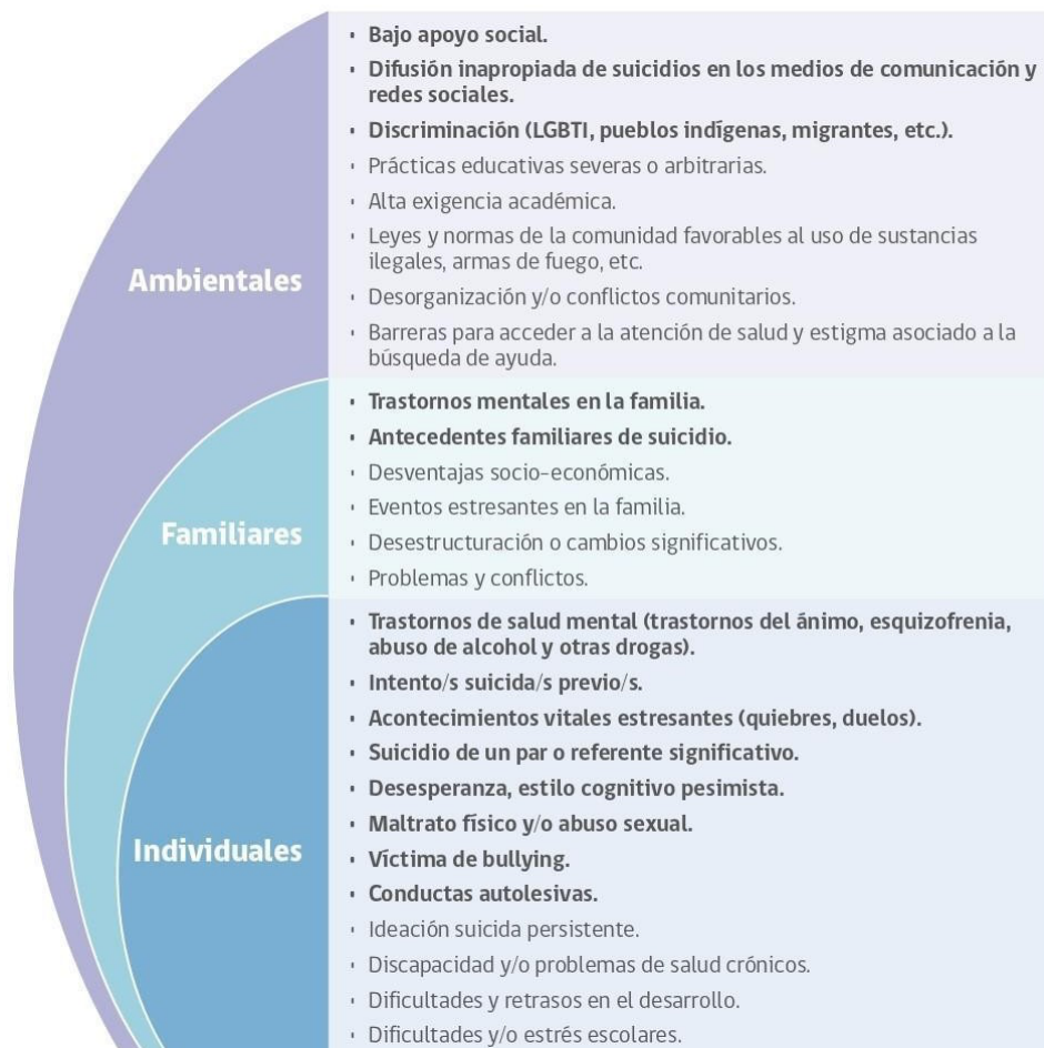
Figura 1: Factores de riesgo de conducta suicida en la etapa escolar.